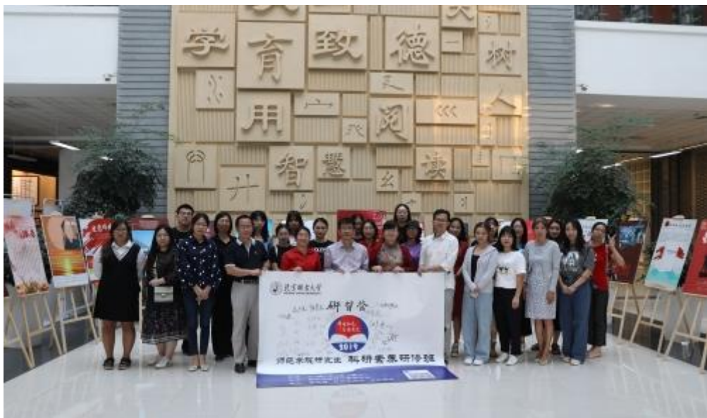
研修班全体师生合影

此次活动是研究生研习营深入学院系列活动的第 2 期研修班，继 5 月 18 日与管理学院合作的第 1 期研修班后，研究生研习营活动得到了持续的发展，参与人数更多，活动内容更丰富，参会学院表示一天的强化训练极大地拓展了自己的视野、明确了自己的努力方向。研究生研习营也将继续沿着深入学院、开拓创新的思路展开不同专题、不同专场的系列活动，为我校研究生培养发挥应有的作用。