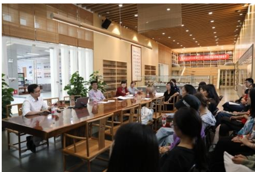
研修班师生交流沙龙